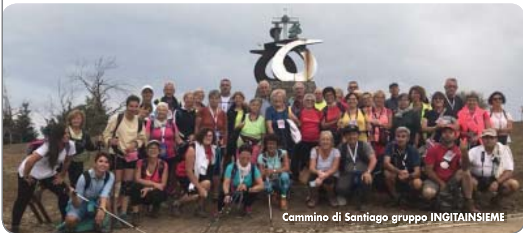
Cammino di Santiago gruppo INGITAINSIEME

Le tappe a piedi seguono esattamente il famoso Cammino di Santiago, e si svolgono su sentieri non asfaltati. Si raccomanda di munirsi, oltre ai normali bagagli, di: un piccolo zaino per portare con sé acqua, frutta o dolci e oggetti personali; vestiti e scarpe comode per le escursioni; cappelli; giacche o giubbotti per la notte (anche in estate la sera rinfresca); k-way.