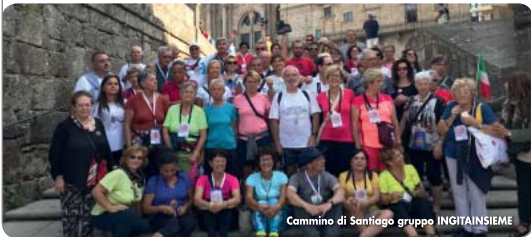
Cammino di Santiago gruppo INGITAINSIEME

Le tappe a piedi seguono esattamente il famoso Cammino di Santiago, e si svolgono su sentieri non asfaltati. Si raccomanda di munirsi, oltre ai normali bagagli, di: un piccolo zaino per portare con sé acqua, frutta o dolci e oggetti personali; vestiti e scarpe comode per le escursioni; cappelli; giacche o giubbotti per la notte (anche in estate la sera rinfresca); k-way.